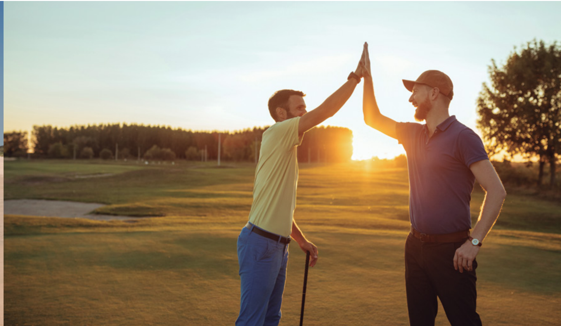
Foto / Campo de golf