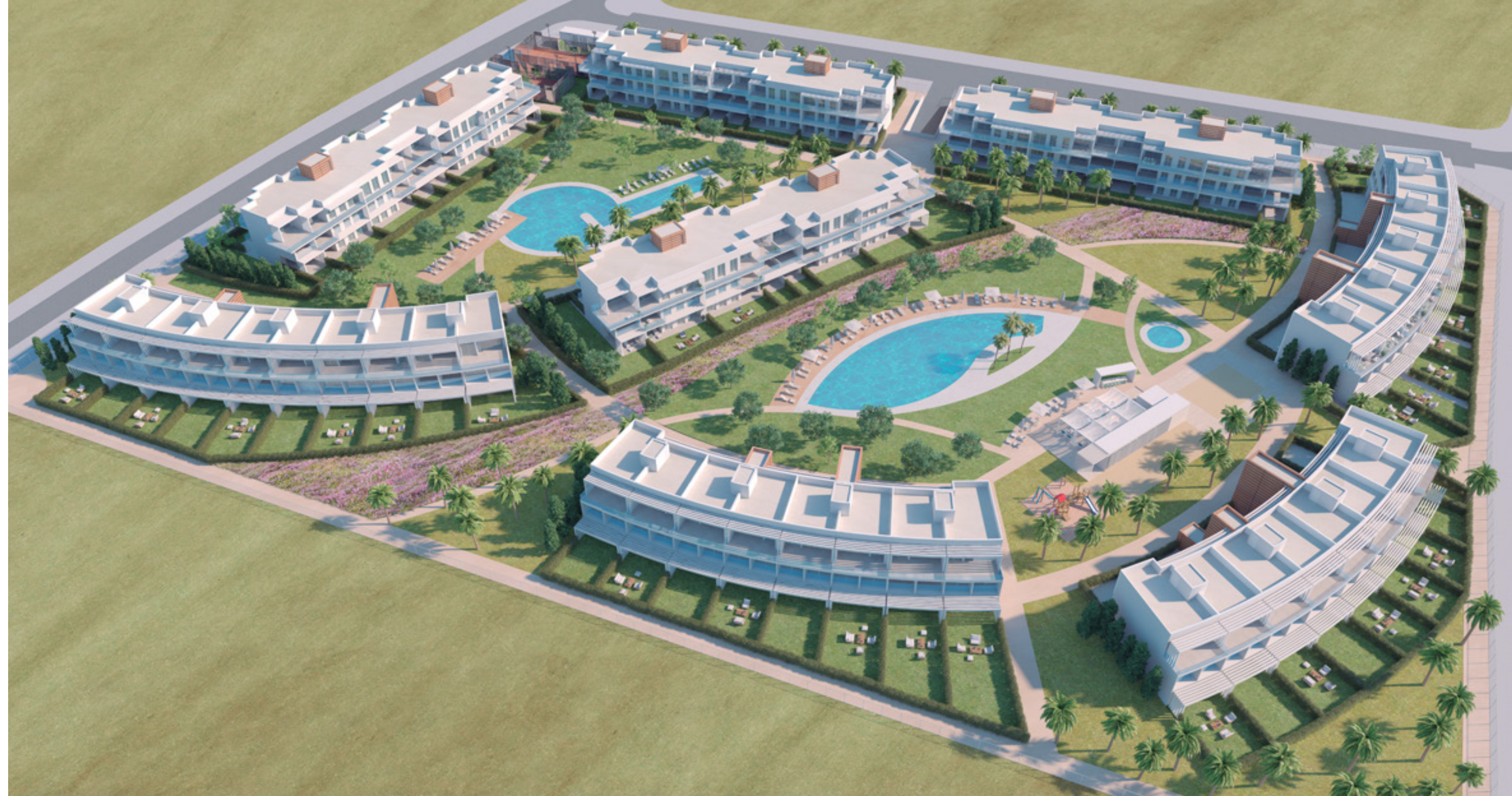
Foto / Vista aérea Playa Azul