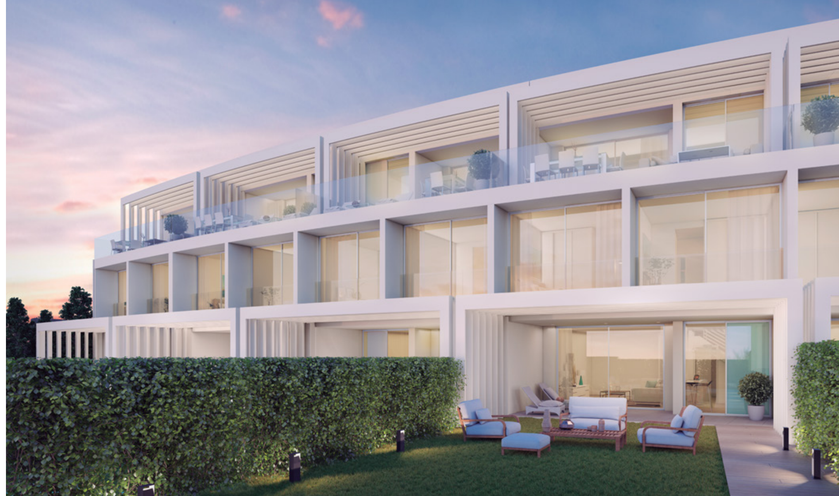
Foto / Fachada Playa Azul

68 viviendas de 2 a 4 dormitorios donde elegir entre apartamentos, áticos con solárium, bajos con jardín y dúplex con terraza y jardines