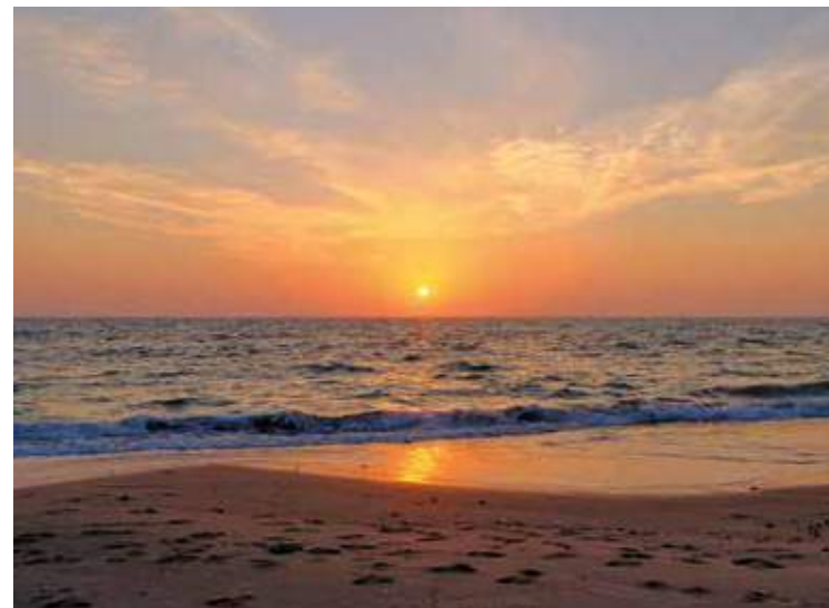
Espacios de vida Natura Costa Ballena

Todo es generoso en Natura Costa Ballena: las espaciosas estancias con diseño de vanguardia, el cuidado interiorismo, los magníficos jardines privados. Amplitud en consonancia con los cinco kilómetros de playas de arena blanca, catalogadas entre las mejores de España.