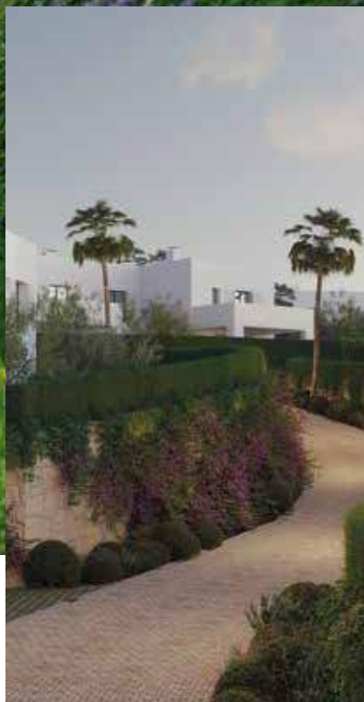
Paseos y zonas verdes en La Reserva de Los Álamos

Verónica de Torres nos cuenta cómo la tradición del sur está viva en los jardines de La Reserva de Los Álamos