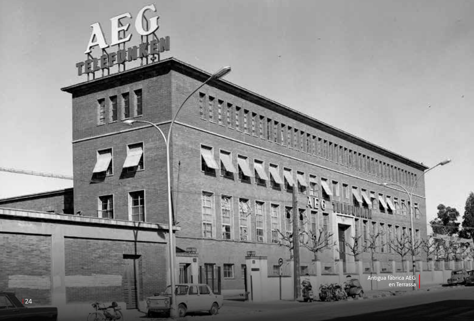
Antigua fábrica AEG en Terrassa