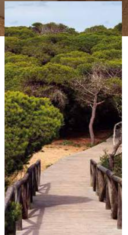
Dunas litorales con pino de pino piñonero

Esa armonía, ese equilibrio, esa sensación de bienestar natural, es la clave de un proyecto único, pensado y ejecutado para perdurar en el tiempo y recuperar la felicidad de los veranos tranquilos en familia.