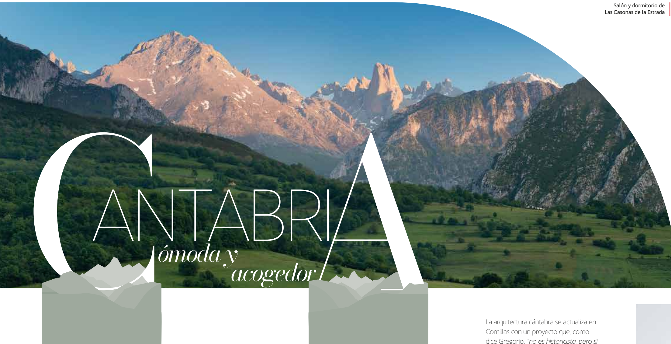
Salón y dormitorio de Las Casonas de la Estrada