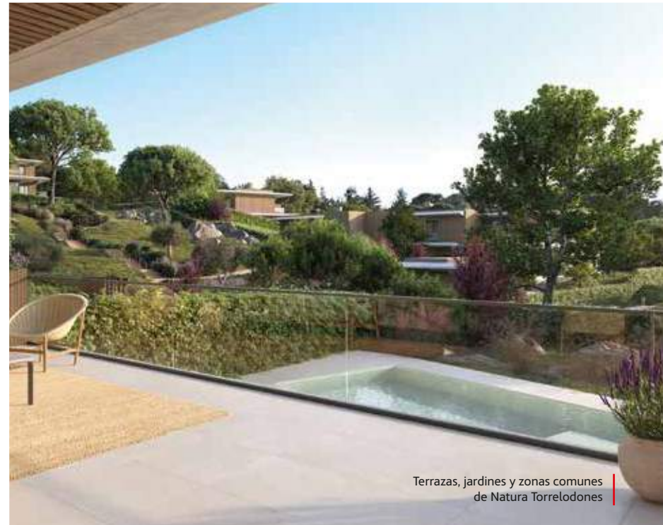
Terrazas, jardines y zonas comunes de Natura Torreloredones