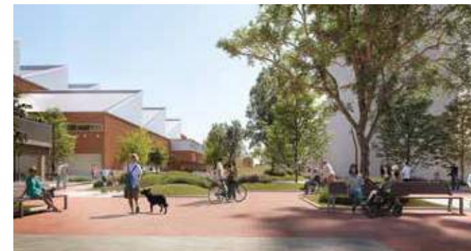
Bulevar central peatonal que vertebra el conjunto