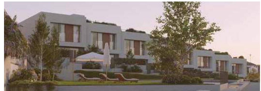
Jardines y zonas comunes de Terra Oleiros

En la lengua de tierra que forma la bahía de A Coruña y la ría de Betanzos, Terra Oleiros ofrece una arquitectura contemporánea abierta y luminosa con un cuidado paisajismo que entiende y extiende la belleza del entorno natural.