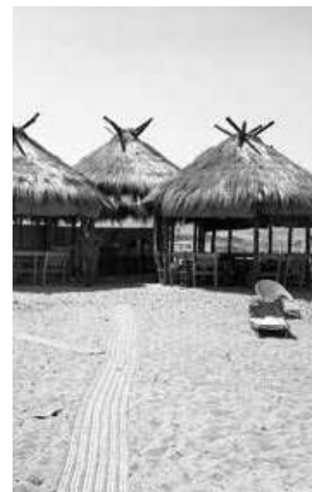
Imágenes del comienzo de Sotogrande en los años 70

En 1962, Joseph McMicking, exitoso hombre de negocios filipino de ascendencia angloespañola, encargó buscar un lugar en el Mediterráneo para crear una zona residencial exclusiva con amplias avenidas de palmeras estilo California, donde se pudiera practicar deporte todos los días. Ese primer Sotogrande, supuso un concepto urbanístico superior nuevo en España, que primaba la amplitud, que integraba campos de golf, de polo, una marina, y que atrajo a la alta sociedad que buscaba anonimato, a la cultura y al deporte de élite de entonces.