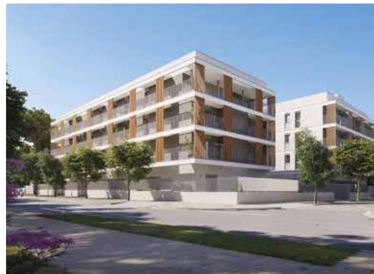
Espacios de vida Parc Domeny en Girona

El diseño responsable, atemporal y equilibrado proyectado por el reconocido estudio TAC Arquitectes, consigue fantásticas vistas al parque de Domeny, máxima luminosidad en cada espacio y los más altos estándares de sostenibilidad, en un conjunto de viviendas de cuidado interiorismo con jardín y piscina.