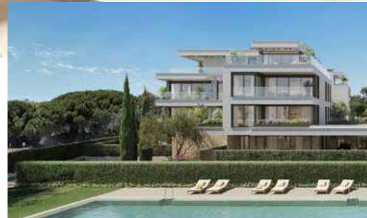
Magníficas terrazas, jardines y zonas comunes en El Puerto de Santa María