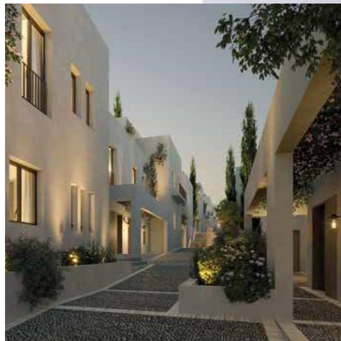
El Pueblito de los Álamos Casas Patio

En cuanto a sostenibilidad activa, propusimos priorizar la circulación mediante coche eléctrico, establecer puntos de carga, hacer una micro ciudad vinculada a la playa vía vehículo eléctrico. Por otro lado, está la propia sostenibilidad en la arquitectura. Más allá de la recirculación de agua, nosotros trabajamos muchísimo el tema de la recirculación de aires, de la borrasca. Como el soleamiento a poniente es durísimo, todas las casas tienen una orientación siempre sur, sureste, que además es la orientación del mar con brisa del Levante.