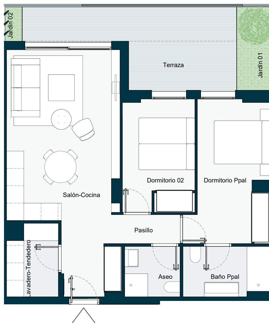
PLANTA DE VIVIENDA