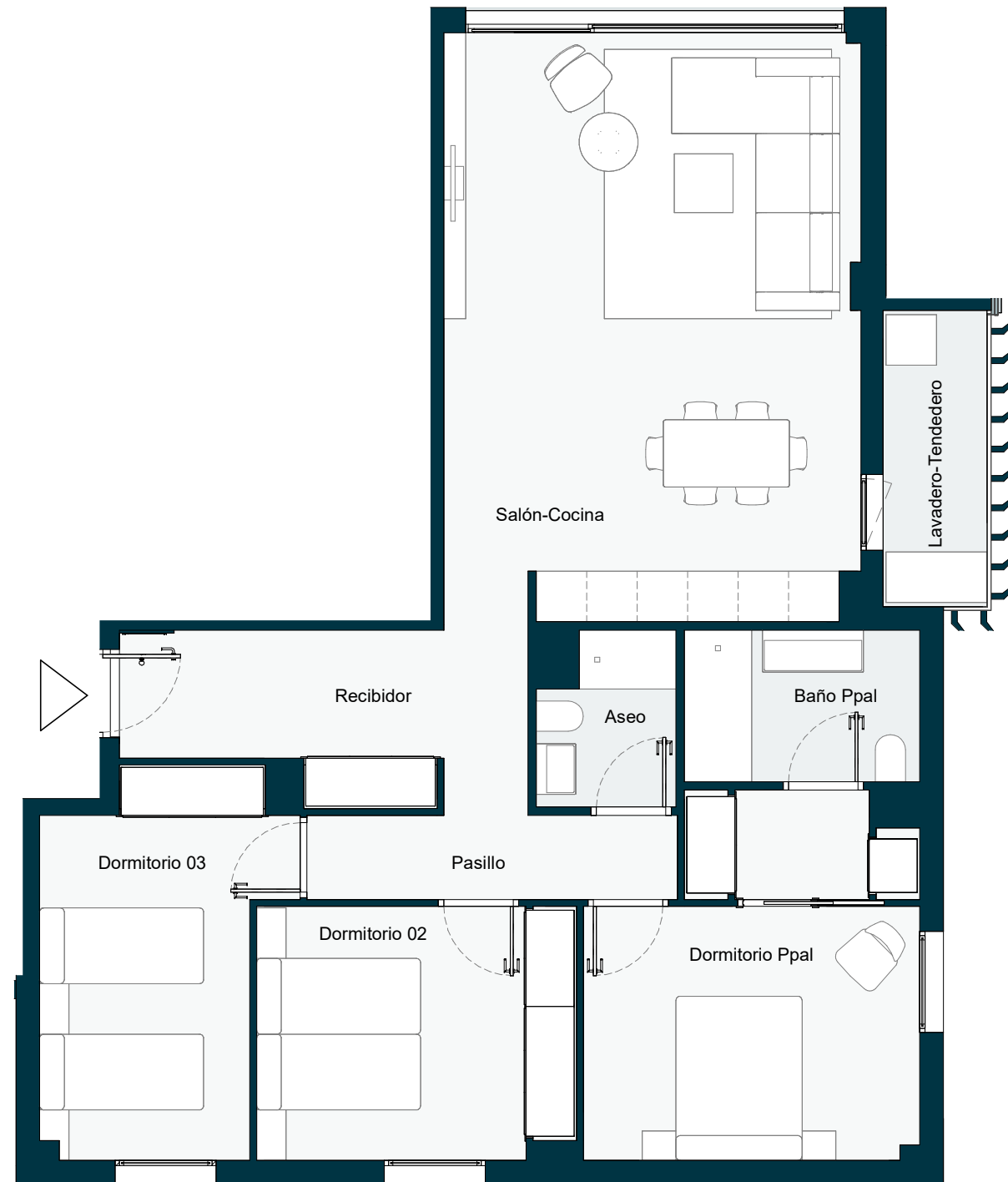
PLANTA DE VIVIENDA INTERIOR